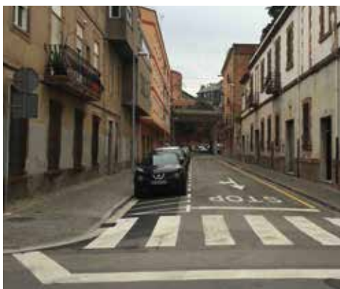
Reforma del carrer de Cerverí