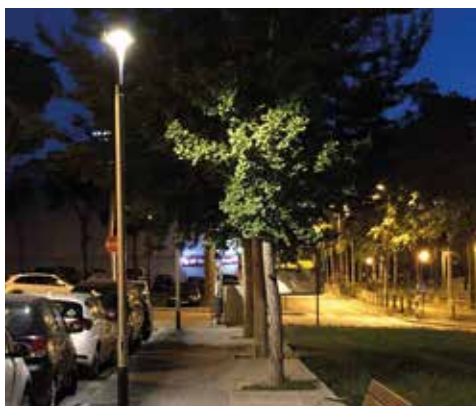
Enllumenat de la vorera de la plaça de Sant Ponç

Tota la informació dels projectes a: www.girona.cat/consultabarris