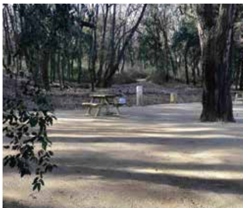
Recuperació de la font de l'Abella