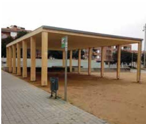
Instal·lació d'un cobert a la plaça de Miquel de Palol

IMATGES D'ALGUNS DELS PROJECTES FINALITZATS EN ELS DARRERS MESOS: