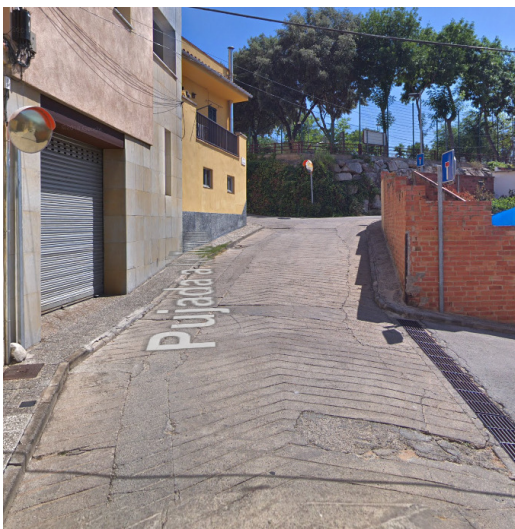
Inici actuació: Número 37

Així doncs, una valoració d'aquest any només cal fer-la en l'àmbit a partir del número 37 fins al final del tram de formigó (pista de bàsquet).