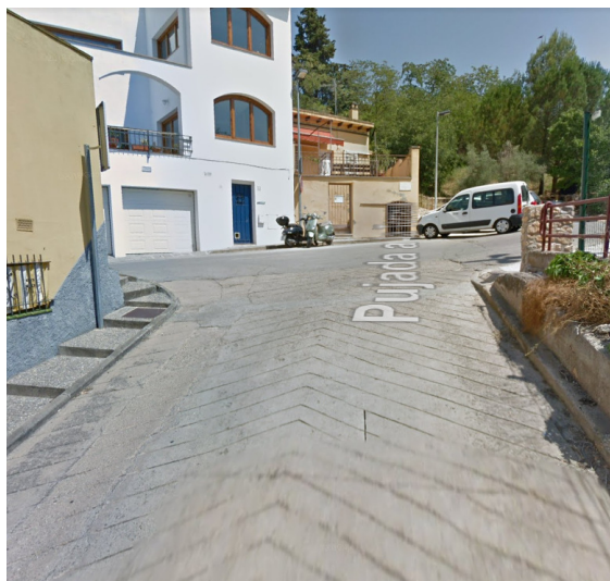
Fi actuació: Pista de bàsquet