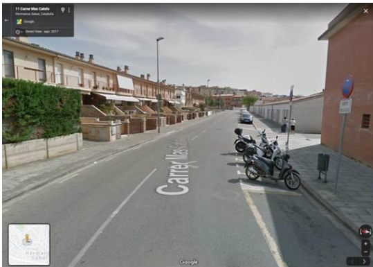
Carrer Mas Catofa.