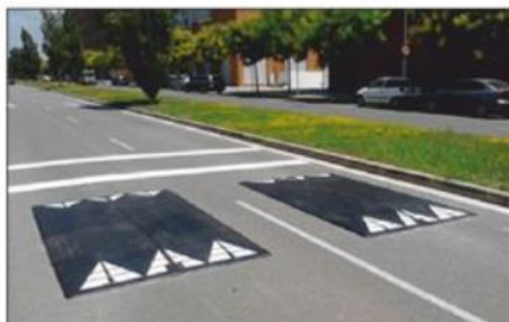
Imatge: coixí Berlinès.

El motiu pel qual només ocupa el centre del carril de circulació és per suavitzar l'impacte dels vehicles de transport públic (autobusos) i vehicles pesats al passar per sobre de l'elevació de la calçada que provoca el coixí berlinès. Només els vehicles lleugers estan obligats a circular per sobre de la part més elevada del coixí berlinès.