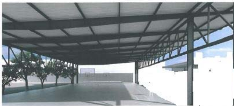
Imatge d'una proposta equivalent de coberta de pista esportiva

PRESSUPOST TOTAL DE L'ACTUACIÓ: 300.410,00 €