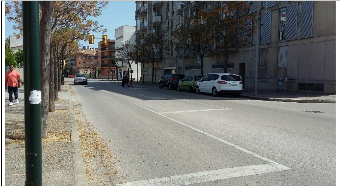
Imatge. Carrer Montnegre. Estat actual.