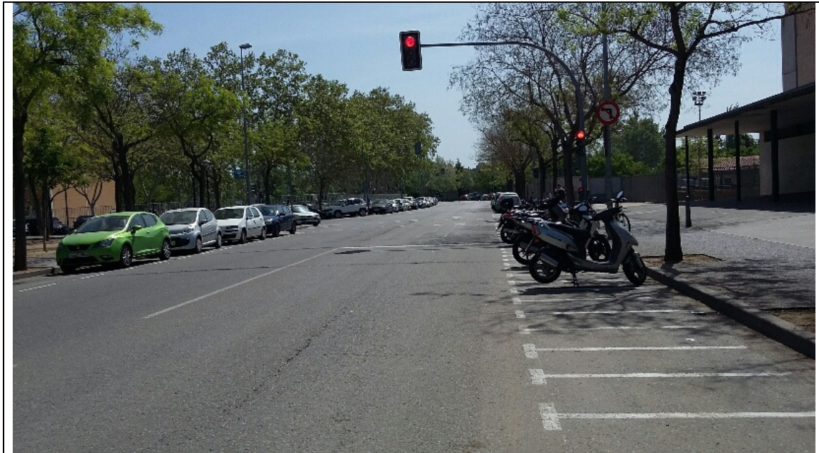
Imatge. Secció actual Marquès i Ribalta