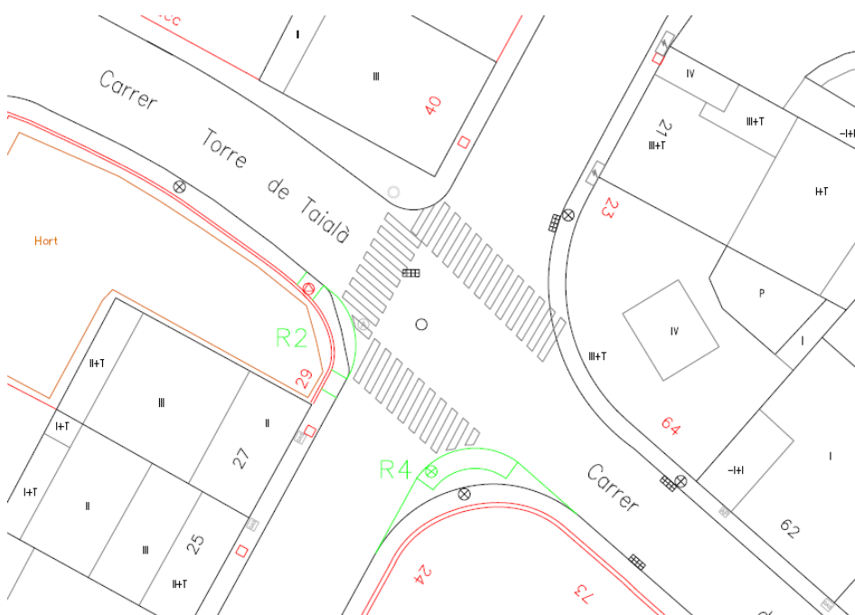
Proposta ampliació cruïlla