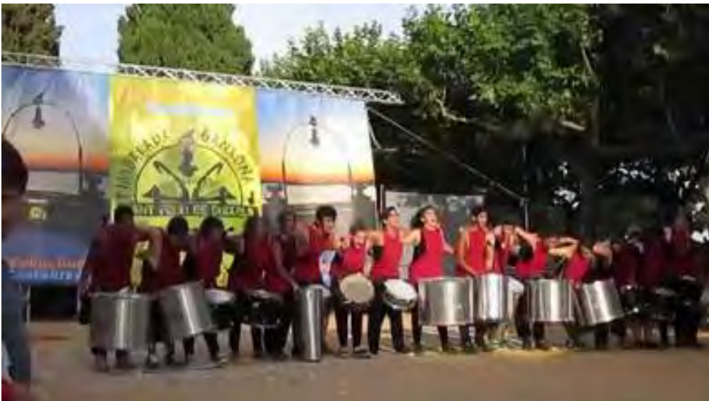
Actuació de SonBarri al concurs de percussió de Sant Feliu de Guixols

Una de les activitats més potents, ha sigut el suport a la creació del grup de percussió SonBarri , el qual gràcies a l'ajuda de TACRES, ha pogut iniciar la seva activitat i donar resposta a les inquietuds artístiques d'un grup de joves del sector. El grup SonBarri segueix amb força, assajant els diumenges i realitzant sortides musicals per la província.