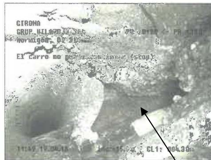
Fotografia: 7b, Nº Video: 0111, 00:02:58 4,3m, El carro no puede continuar (stop)

Inspecció TV de l'interior de la xarxa (19/04/16): Ruptures i juntes obertes (manca d'estanquitat)