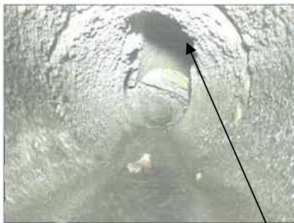
Fotografia: 5a, Nº Video: 0111, 00:02:10 4,3m, Roturas. Falta trozos desde 07 hasta 05 horas

La xarxa pública de sanejament de la part posterior dels edificis plurifamiliars situats al Grup Vila-roja núms. 162, 163 i 164, es tracta d'una conducció de formigó de diàmetre 200mm, amb poc pendent i que presenta un avançat de degradació. És per aquest motiu, per la qual cosa es generen embussos freqüents i filtracions d'aigües residuals cap al mur contenció que salva el desnivell amb la zona contigua on hi ha el de paviment rodat del costat. Així mateix, el paviment de formigó sota el qual passa la claveguera pública, es troba en molt mal estat de conservació, amb nombroses esquerdes i desnivells.