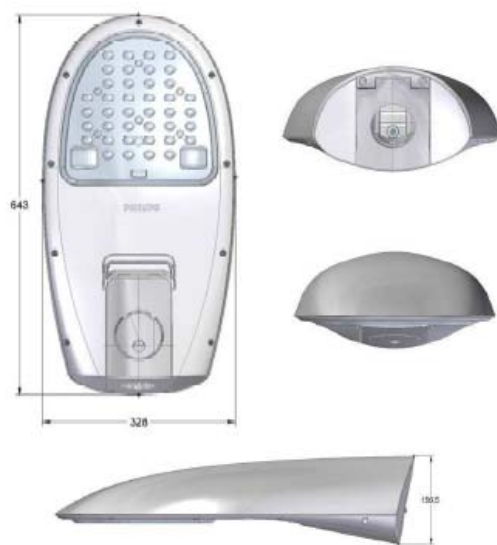
Iridium gen3 Mediana

L'enllumenat de l'avinguda Amical Mauthausen actualment està format per lluminàries de vapor de sodi d'alta pressió de 150W. Es proposa mantenir les columnes i no fer canvis als quadres elèctrics i canviar les lluminàries actuals per unes altres tipus Philips Iridium Gen3 BGP382 GRN65/740 11 DM GR CO SP de leds de 53W de potència. En total seran 23 lluminàries a l'avinguda Amical Mauthausen. Aquestes noves lluminàries són les mateixes que es col·locaran al carrer Narcís Roca i Farreras arrel dels pressupostos participats de 2015 i permetran obtenir una millor il·luminació d'aquests carrers així com generar estalvi energètic en tenir menor potència i un menor manteniment degut a la major durabilitat de les lluminàries de leds.