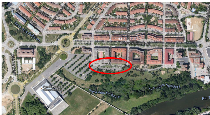
Aparcament carrer Fontajau.