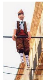
L'home da la Barra de Tàrrega