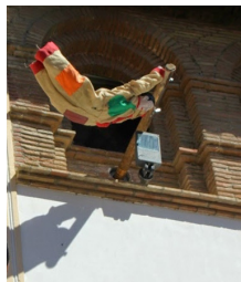
Furtaperes de Graus