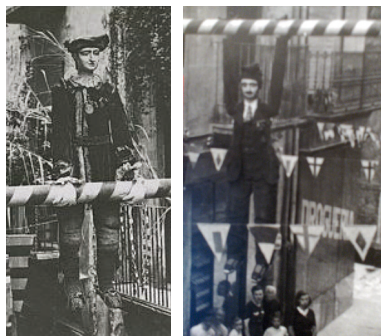
Tarlà de principis i mitjans del segle XX