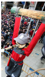
Volantín de Tudela