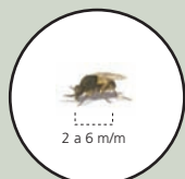
Mosca a mida real

Els simúlids o mosques negres són unes mosques autòctones, petites, d'una mida entre 2 i 6 mm, de color generalment fosc, amb el cos rabassut, les antenes i les potes curtes i les ales més grans.