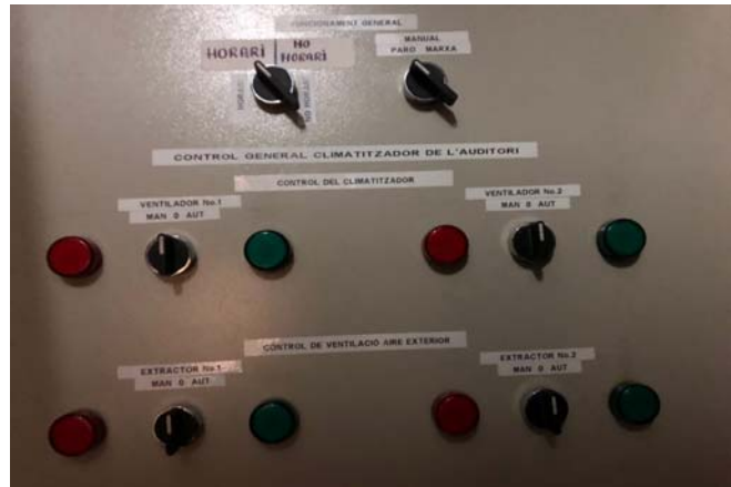
Quadre de control clima