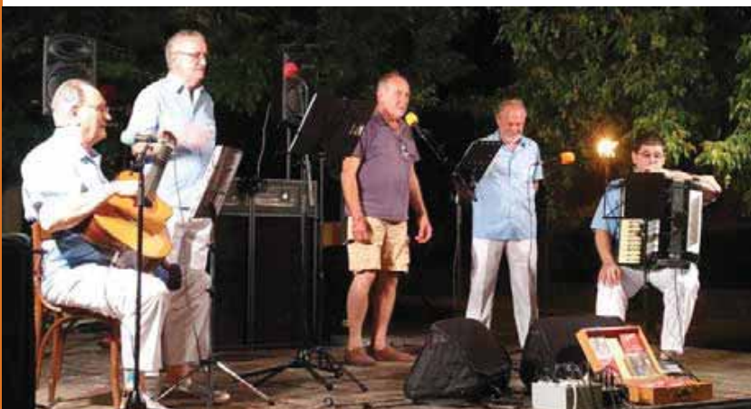
Cantada d'Havaneres de la festa major

Organitzen i col·laboren en activitats i actes commemoratius i comunitaris del barri, especialment per Nadal i la Festa Major. Impulsen projectes de preservació i difusió de la memòria local com La Gegantona i Preservem la memòria .