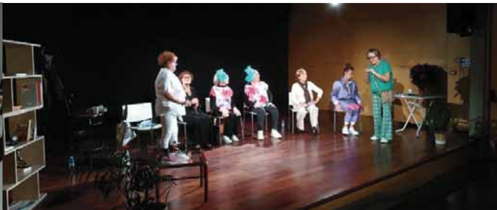
Representació de l'obra “Aquí n'hi ha de Tocs colors”