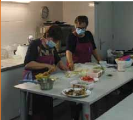
Cursos de Cuina

A més d'organitzar cursos d'activitat física, gimnàstica, idiomes, cuina, pastisseria, balls de saló... Organitzen activitats culturals, actes commemoratius del 25N i 8M, i contribueixen en els actes festius del barri. Enguany celebren 20 anys