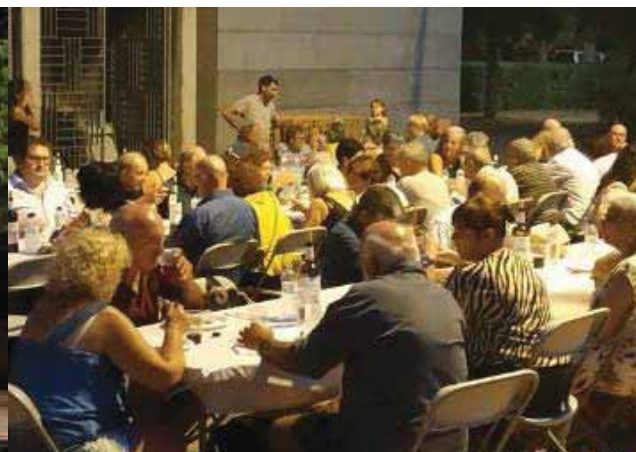
Sopar de Festa Major