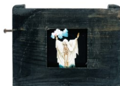
Placa de vidre per a lanterna màgica (tipus fix) per a espectacles de fantasmagoria. Fabricant desconegut. Lloret de Mar, ca. 1850.

des perquè es projectessin mitjançant tècniques de fantasmagoria, és a dir, amb la lanterna oculta darrere la pantalla per incantar i convèncer l'espectador d'una presència sobrenatural. Per tal de donar més impacte i veracitat a les imatges projectades, sovint aquestes estaven animades mitjançant diversos mecanismes, i també es pintaven sobre fons negre, per tal d'eliminar la llum superflua i que només aparegués il·luminat a la pantalla el subjecte pintat a la placa de vidre.