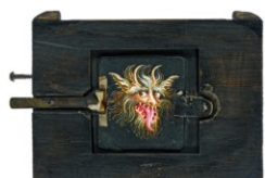
Placa de vidre per a lanterna màgica (tipus mòbil) fixada a una esplanant de fantasmagoria. Fabricant desconegut. Tête de monstre a langue rouge. Ca. 1850.