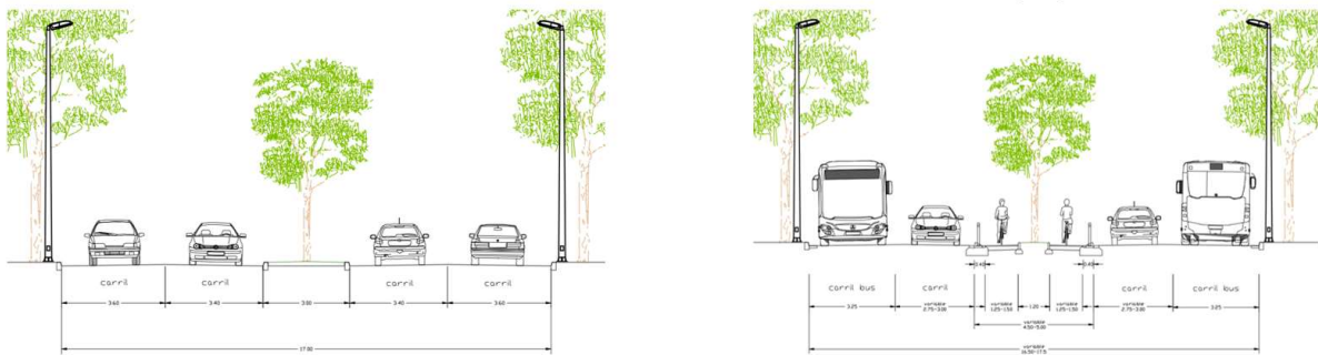
Reconfiguració d'un tram del passeig dels Països Catalans; a l'esquerra, situació actual, a la dreta, la nova

El Departament de Territori ha adjudicat les obres del corredor de bus ràpid (BRCat), entre Girona i Salt, per un import de 5 MEUR. Aquesta actuació suposa una millora integral de l'eix metropolità Salt – Girona que potenciarà la mobilitat sostenible, tant en autobús, com també en bicicleta i a peu. Els treballs començaran a finals d'aquesta primavera.