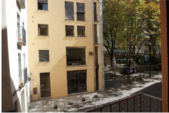
Vistes des del balcó sobre el carrer dels Calderers