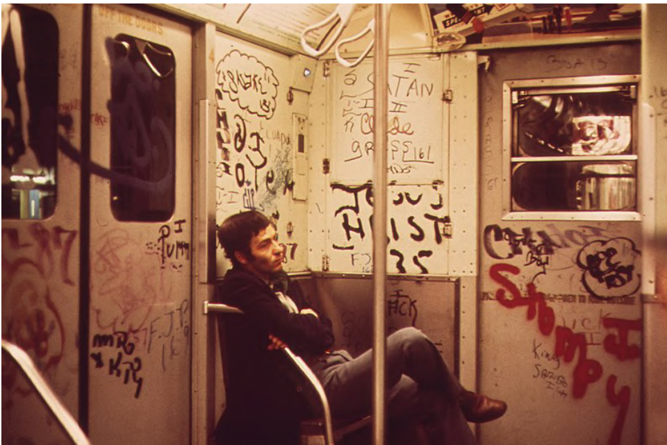
Vagó de metro ple de tags. Nova York, 1973. Imatge: domini públic.

Per parlar dels graffiti que coneixem actualment ens hem de situar al segle XX, a finals dels anys seixanta, a la ciutat de Nova York, on els diaris van utilitzar la paraula graffiti per parlar de les pintades que es van popularitzar de forma massiva als barris més degradats i superpoblats. Les primeres expressions que van omplir metros i trens de Nova York van ser les signatures, els denominats tags. Pintaven als trens, sobretot, perquè així la seva signatura era vista per tota la ciutat, tot i que suposava un risc alt, a vegades ho feien mentre estava en marxa el metro.