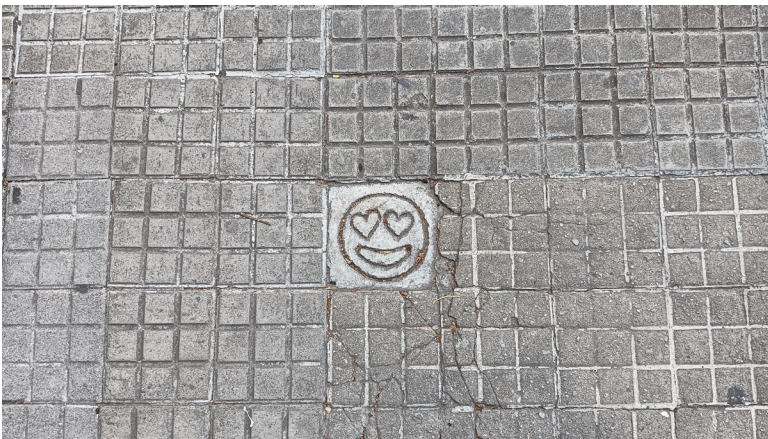
20 3ttman 2016. Gran Via de Jaume I

La seva obra es caracteritza pels colors vius amb contrastes elevats i formes dinàmiques que busquen transmetre optimisme. Trobem les seves intervencions a diferents indrets de Girona, especialment en persianes de comerços i portals, les quals podem identificar fàcilment degut al seu particular estil.