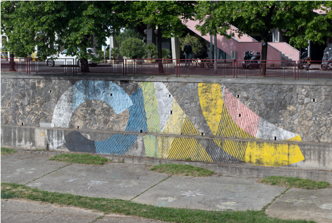
1 Momo 2012. Passeig del General Mendoza, 9

Momo és un artista nascut a San Francisco l'any 1974 que ha dut a terme tres intervencions a Girona, aquesta va ser la primera, l'any 2012. Les altres dues les va portar a terme en els dos anys següents i les podeu trobar a la carretera de Barcelona, 53 i a l'avinguda de Sant Narcís amb el carrer de Martí Sureda. Totes les obres desenvolupades a Girona tenen una estètica comuna: l'abstracció.