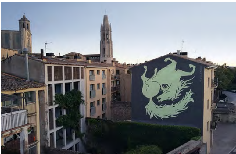
27 reskate 2017. Carrer de Sant Pau

Les seves intervencions tenen un punt d'ingenuïtat, aparentment, ja que domina perfectament l'espai grandiloqüent de forma estructurada i precisa. Els colors suaus es combinen geomètricament en un joc de llums i ombres que doten el dibuix d'una gran força. En la seva intervenció al Festival Milestone Project a Girona l'any 2015, ens va deixar una mostra que reflecteix perfectament la seva forma de treballar habitual amb la figura d'un home que se situa entremig dels núvols per somniar.