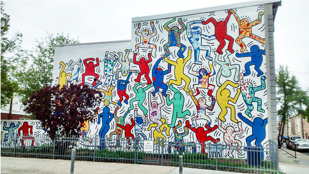
We are the youth de Keith Haring, 1987.