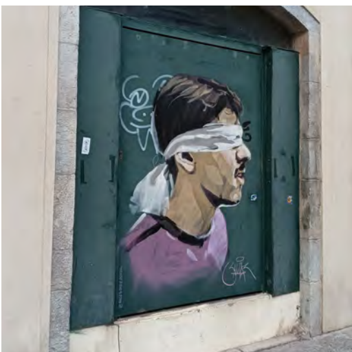
25 RICE 2020. Plaça de Sant Pere

L'artista ens mostra, en aquest cas, el típic paisatge de Girona, tot i que reinterpretat amb el seu estil particular.