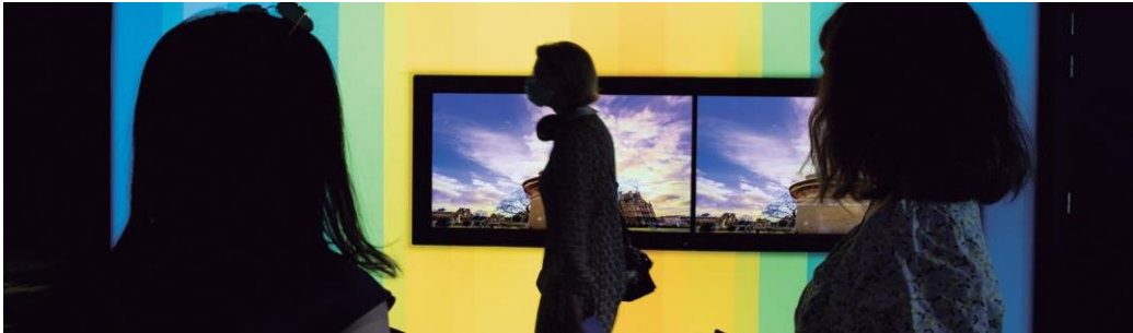
Visita el Parlament Europeu