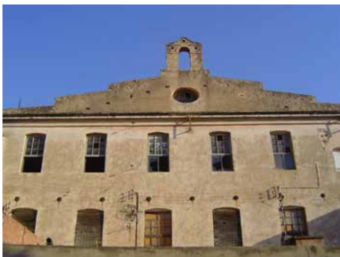
Façana de la fàbrica, abans de la rehabilitació

Catalunya va passar de ser una zona eminentment agrícola, a una zona industrial, canvi que es va produir entre els segles XVIII i XIX. Aquesta transformació també arriba al nostre poble, Santa Eugènia. El referent més important que tenim és la fàbrica tèxtil Marfà.