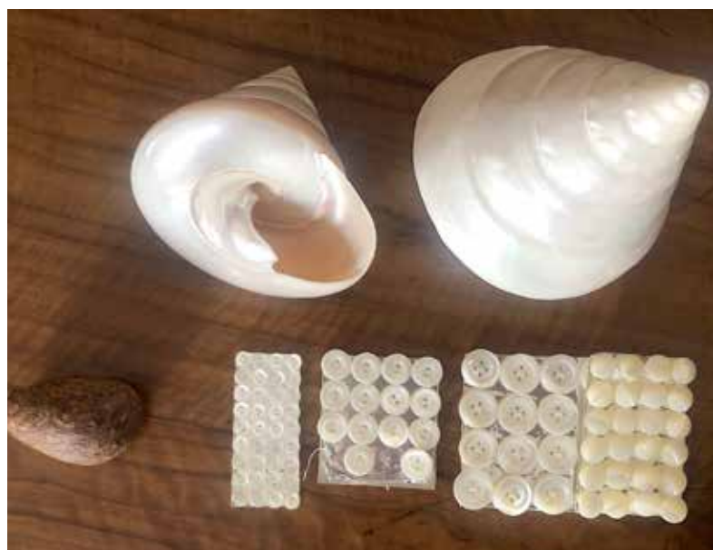
Matèria primera per fer els botons de la Grober: coco i nàcar

Cal destacar en la tasca social de l'Empresa, la instal·lació d'escoles bressol per als fills de les treballadores, que va arribar a acollir 100 nens i nenes a les de Girona i Bescanó. També hi havia un Eco-