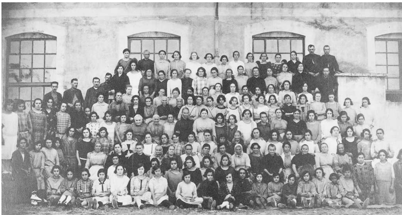
Grup de treballadors i treballadores de la Fàbrica Marfà

a l'antiga fàbrica Coma. Cros amb la qual cosa ja finalitza la seva producció.