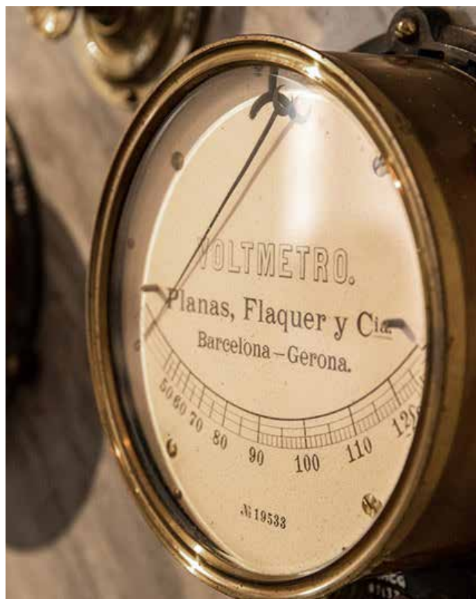
Detalle del Voltímetro de Planas, Flaquer y Cia (Xènia Gasull)

Després d'uns primers assaigs els anys 1883 i 85 a la Rambla i a l'actual plaça del Vi, la ciutat va inaugurar la innovadora instal·lació d'un enllumenat elèctric públic el 24 de juliol de 1886. Es considera Girona capdavantera en la utilització del corrent