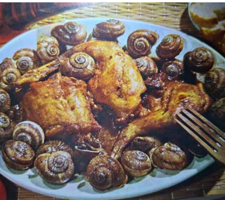
Conill amb cargols

Els cuiners i sobretot les cuineres de “pagès” i les minyones de servei que fugien del terrós per a sobreviure servint a la gent acomodada, anaren traslladant a les cuines urbanes i les fondes l'exquisidesa de les preparacions antigues.