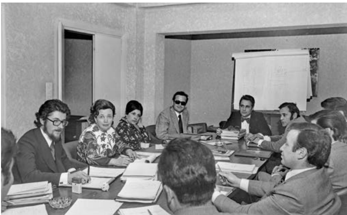
Reunió de treball en una oficina, probablement a Girona. 1973.

És l'evolució de la societat, guanyem moltes coses i alhora anem deixant d'altres pel camí. Que en la balança pesin més els guanys és el camí que hauríem de seguir.