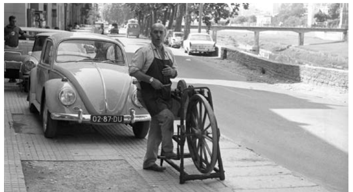
Escenes de Girona. Esmolet amb les seves eines al carrer del Carme, amb el pont de Lorenzana al fons. 1967.

Si feu un recorregut per les nostres contrades podreu observar que alguns noms de cases ens recorden l'ofici dels seus residents, fins i tot noms d'algun barri. Ben coneguts són a Girona, barris com les Peixateries, les Ballesteries... Noms d'algunes cases les trobem a Cal Carboner, Cal Carreter, Cal Ferrer, Cal Sastre..., tot fruit d'un passat recent encara i que reviu en la nostra memòria.