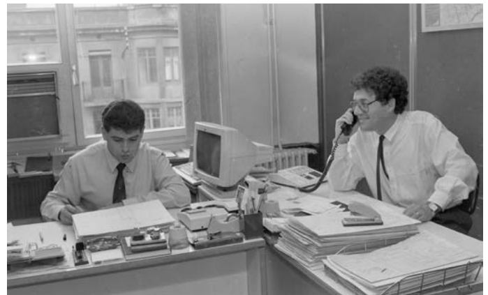
Dos homes treballant en una oficina situada al carrer Gran Via. Girona. 1989.