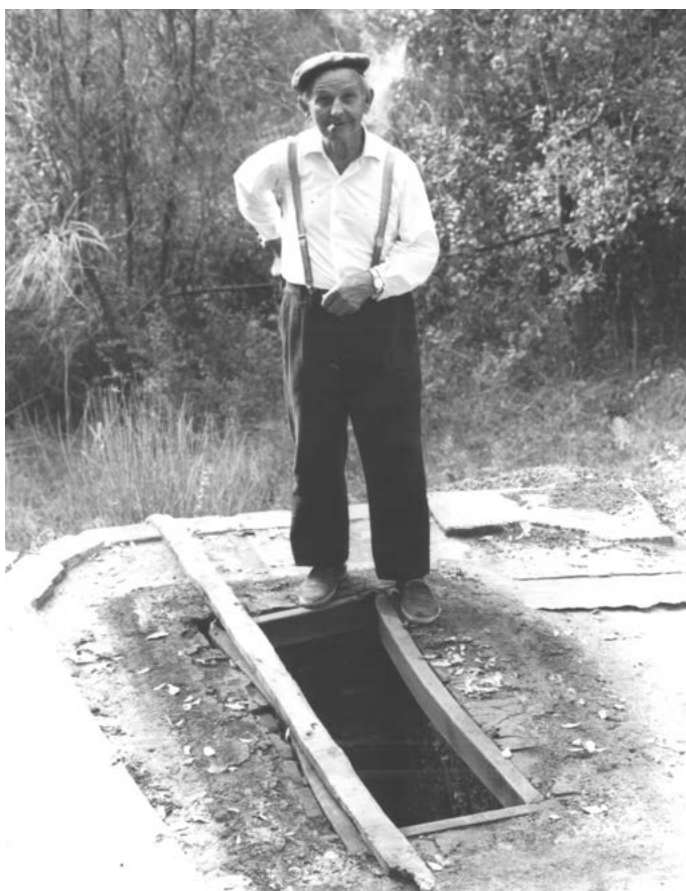
Carboner d'ofici. 1994.

Voldria fer referència aquí a oficis que l'home ha anat realitzant dins la comunitat i que molts de nosaltres recordem amb certa enyorança, que no estan tan allunyats dels nostres temps i que fins i tot algú de nosaltres ha viscut molt a prop