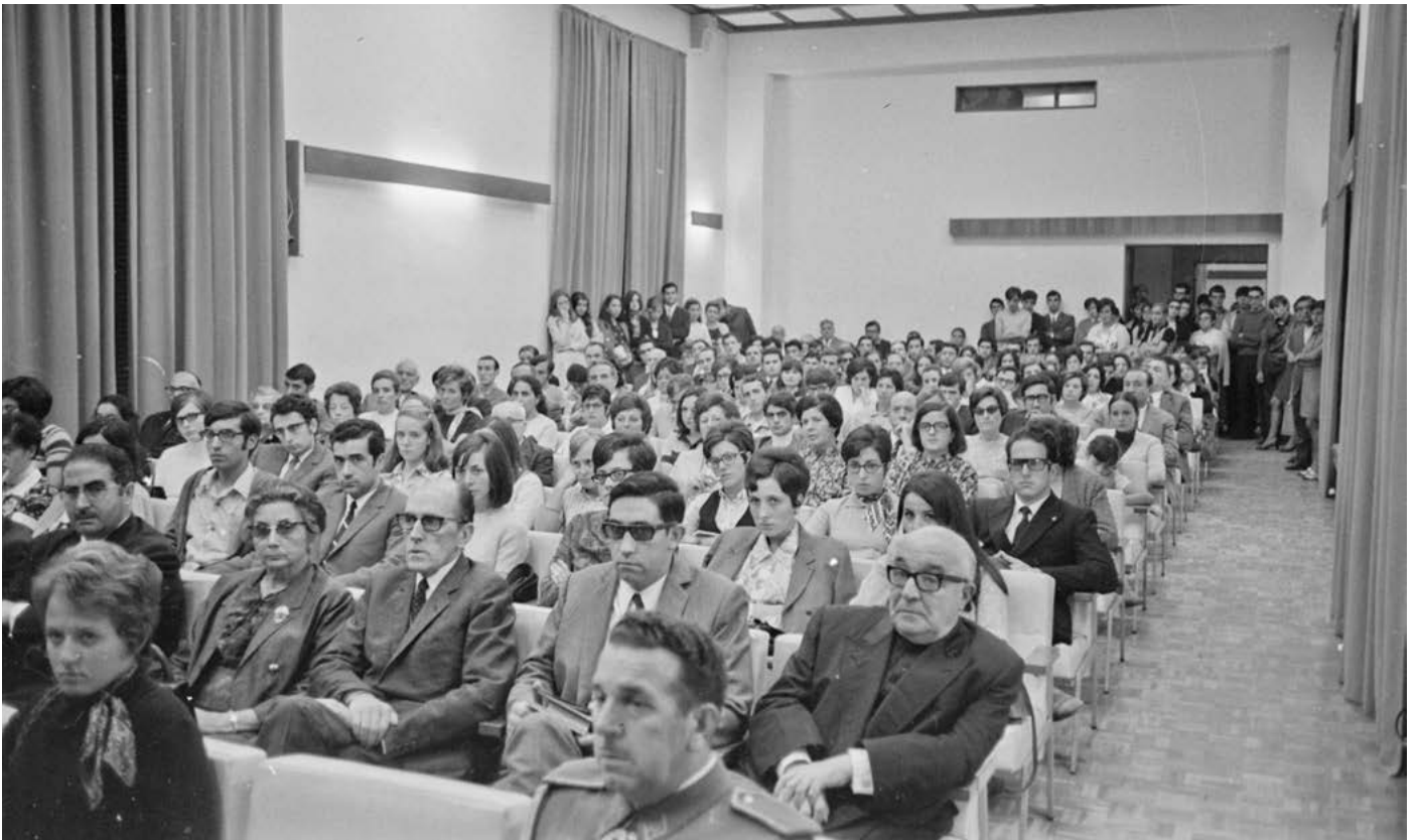
Aula Magna inauguració: Crèdit: Ajuntament de Girona CRDI (Narcís Sans Prat)