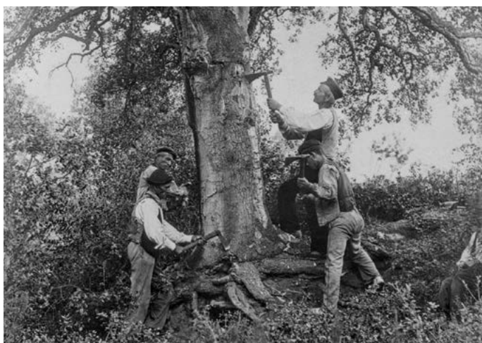
Reproducció d'una fotografia de surers pelant sureres a Palamós. 1933.