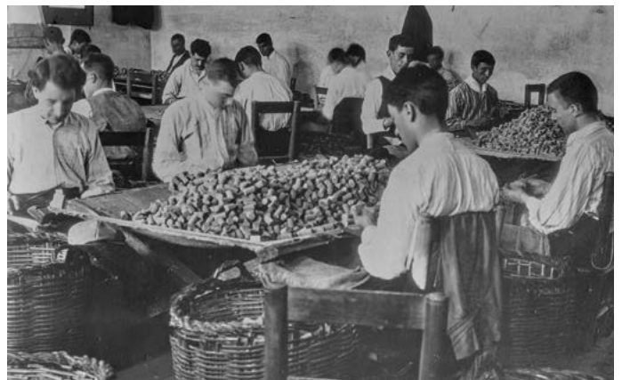
Reproducció d'una fotografia de surers triant taps de suro a Palamós. 1933.