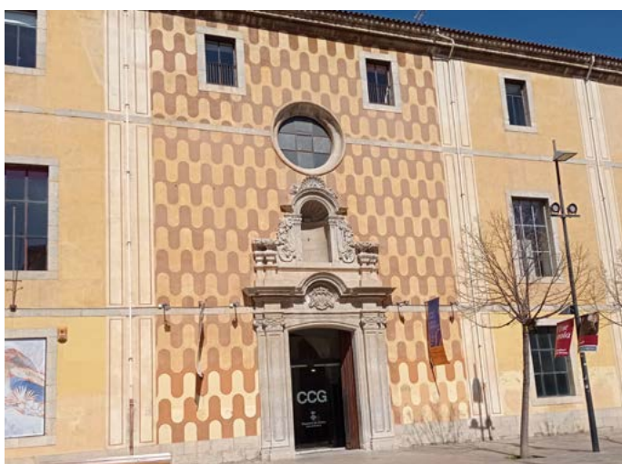
Entrada Casa Cultura