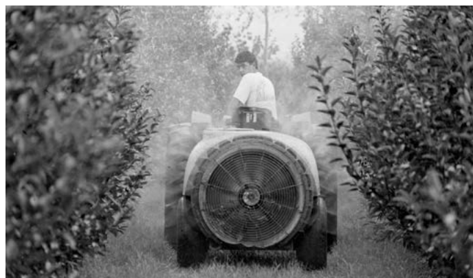
Noi conduint un tractor agrícola en un terreny amb arbres fruiters, possiblement pomeres. Lloc no identificat. 1989.

Boter: era l'encarregat de fer botes, tines, tonells... destinats a contenir líquids, sobretot vi. Ofici que data del segle XIII. En trobem a totes les ciutats i viles