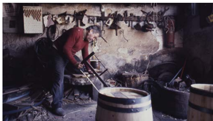
Botero de Pedret. 1990.