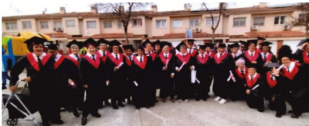
Foto de universitàries del dia 2 de març, Carnestoltes de l'Esquerra del Ter