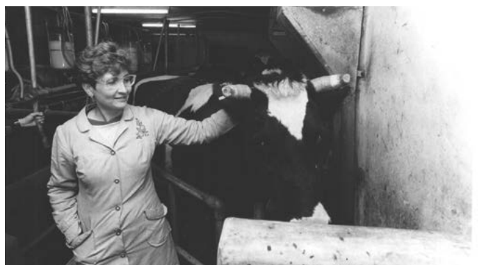
Pagesos d'ofici, ramaderia. 1988.