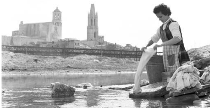
Dona rentant la roba al riu Ter. Al fons el pont del Ferrocarril, la Catedral i el campanar de l'església de Sant Feliu. 1960.

Cisteller: ofici consistent en elaboració de cistells, en principi per a tasques del camp, com a contenidor de productes agraris. Habitualment s'utilitzava el vímet. Amb el temps va anar evolucionant a molts tipus de contenidors fins i tot s'arribà a produir productes per a l'oci o la decoració.