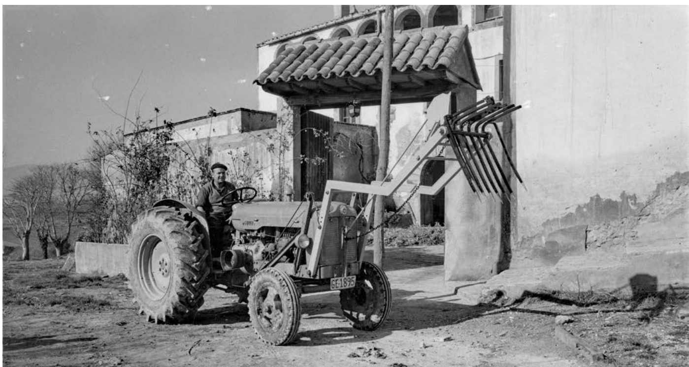
Maquinària agrícola. Retrat d'un home amb un tractor davant d'un mas. Cornellà del Terri. 1964.