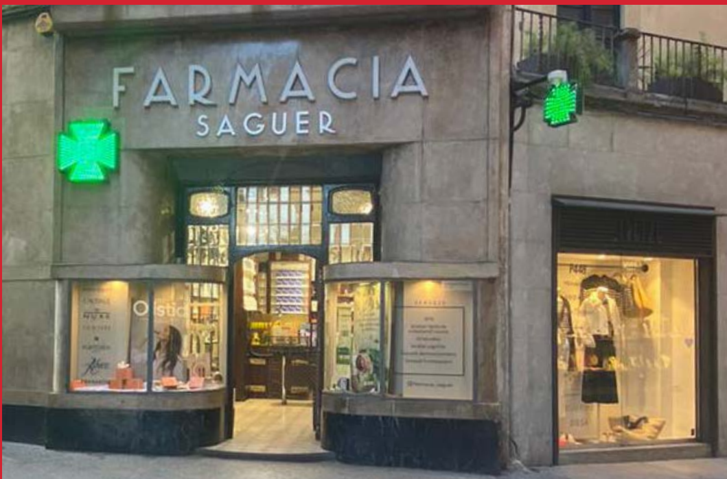
Farmàcia Saguer, al carrer Ar- genteria de Girona. Any 1957

La farmàcia, projectada per Rafael Masó el 1908 i reformada per Josep Claret Rubira el 1935, combina un interior modernista amb un exterior racionalista. Masó va utilitzar materials com la majòlica blanca i formes orgàniques, mentre Claret va optar per marbre rosat i línies corbes sense decoració. Els detalls interiors incloïen ceràmica blanca i ferro forjat.