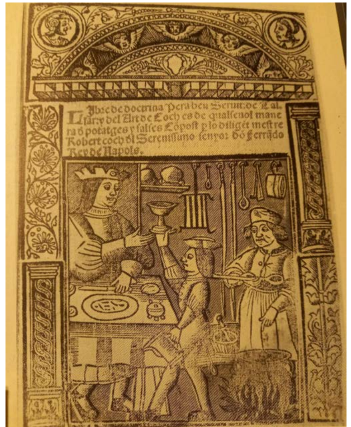
Portada del llibre de Coch, de Robert de Nola

Ben cert que tant el concepte de gastronomia com la seva pràctica cal aplicar-los als costums i formes de la cuina de les classes benestants.