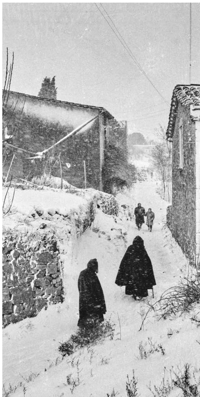
Carrer de la Muralla, al barri de Torre Gironella de Girona, durant una nevada. S'observen diferents persones caminant pel carrer. 1962.

Les botigues de barri van acabar totes les existències, ja que tampoc hi havia servei d'abastament. Barcelona no estava preparada per a una situació tan caòtica i els problemes van ser molt complicats de solucionar.