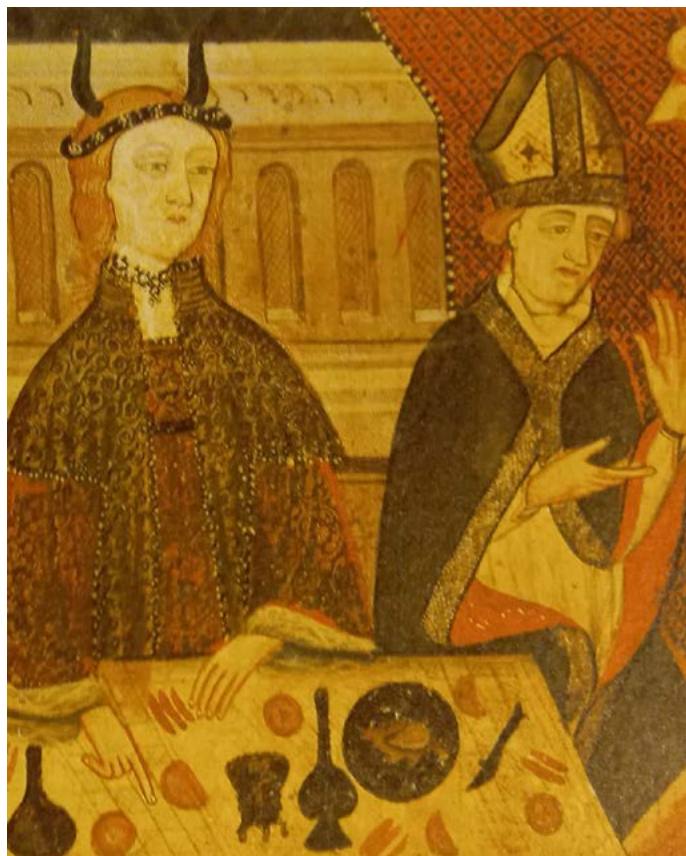
Fragment del retaule del mestre de Castellfollit vers el 1400

La cuina medieval catalana estava molt relacionada amb la de les zones europees més pròximes a través de les classes altes i els ordes religiosos en els seus monestirs, com ja s'ha dit.