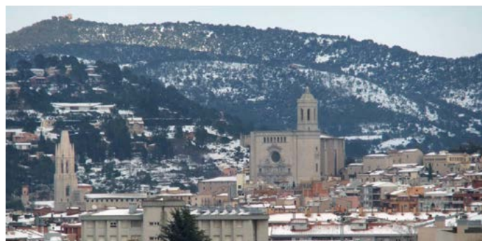
Nevada a Girona 2006

de l'hivern, va agafar molta gent per sorpresa. Va començar al migdia i es va anar intensificant, amb molts problemes de carreteres tallades, cotxes bloquejats amb gent dins que no sabia què fer ni on anar. Es va parar la circulació de trens i va haver-hi un caos molt greu. A més, la llum i l'aigua van quedar tallades, amb molts problemes per a les empreses i la gent en el seu dia a dia. Les conseqüències van ser responsabilitzar al govern de la Generalitat d'improvisació davant les dificultats, ja que els meteoròlegs ho havien avisat i no es va fer res per evitar el desastre.