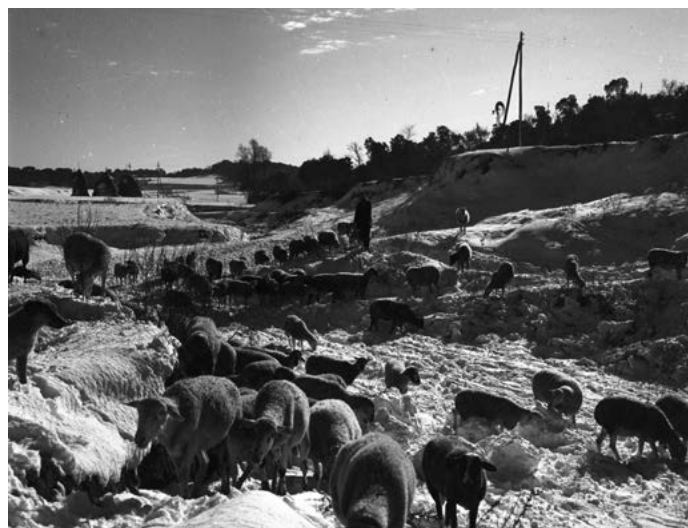
Nevada a Girona. Zona de Palau-sacosta nevada. Ramat de xais pasturant acompanyats d'un pastor. 1962.

Només podem dir que la vida s'ha de gaudir mentre puguem i buscar la felicitat amb les petites coses del dia a dia... el futur sempre és un destí desconegut.