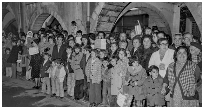
Cavalcada dels Reis Mags a la ciutat de Girona. Famílies esperant la comitiva reial a la plaça del Vi. 1975.

Per fer créixer la ciutat cal un procés continu que requereix la participació de tothom; la comunitat, autoritats locals i altres actors clau. La participació activa i el compromís són fonamentals per crear una ciutat més acollidora, humana i atractiva per a tots i totes. Girona enamora sempre, amb la calor i el fred, a la tardor i quan les flors embelleixen els racons.