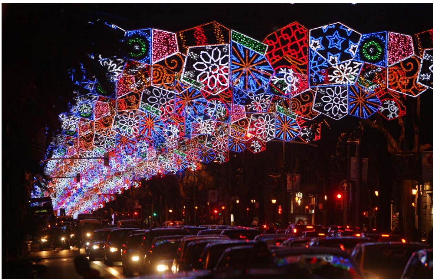
Encesa dels llums del Nadal, Diagonal. Barcelona. 2010.