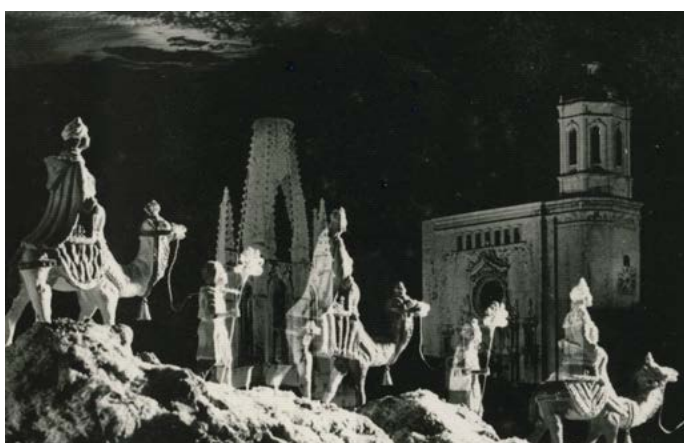
Fotomuntatge amb una composició nadalenca amb figures dels tres reis, patges i camells i la imatge de la Catedral de Girona i el campanar de l'església de Sant Feliu (possiblement per a una postal de Nadal). 1960.