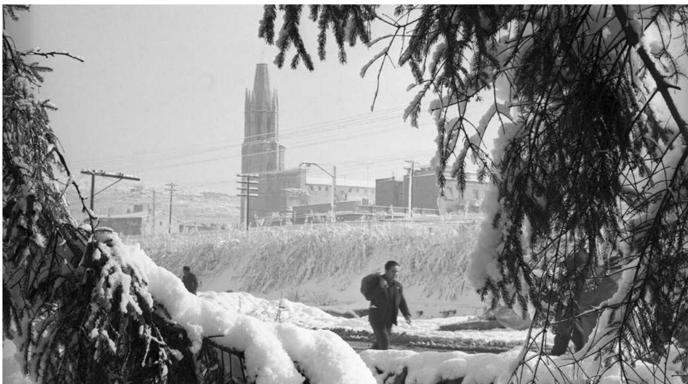
Vistes de diferents indrets de la ciutat després d'una nevada. L'església de Sant Feliu i el terraplè del tren vistos des de la Devesa. 1962.

Barcelona no estava preparada per a una situació tan caòtica i els problemes van ser molt complicats de solucionar