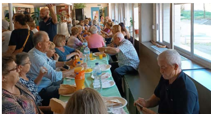
Berenar de Fires 2023

Amb molta il·lusió engegarem l'any amb algunes propostes. A partir del mes de gener, iniciarem un taller de treballs manuals obert a totes les persones grans del sector, així com a la resta de persones grans de la ciutat de Girona. Continuarem amb els tallers per treballar la memòria, els tallers de xarxes socials i de jocs de taula, amb la col·laboració de l'espai Tres Punts del Centre Cívic Onyar i Òmnia, els tallers de musicoteràpia i altres activitats que anirem explicant al llarg del 2024. Esteu tots convidats a participar en aquests tallers, que més enllà de la formació que ens donen, busquen ser un punt de trobada on poder compartir moments i experiències de tots nosaltres. Podeu trobar més informació a https://web.girona.cat/ccivics/onyar/cursos .