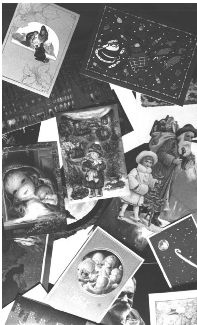
Felicitacions de Nadal. 1992.

Gaudim de les festes, de les noves tradicions, de poder estar junts un any més desitjant-nos unes bones festes i un bon Any Nou, com jo els hi desitjo a tots vostès, que fan possible aquesta revista i a tots els lectors que l'esperen amb interès i il·lusió.